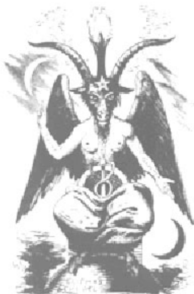
Dibujo realizado por Eliphas Lévi