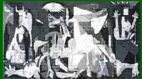
La violencia solo engendra más violencia

Siram Abif , más que un mito o leyenda, es un paradigma de genialidad, perseverancia, racionalidad y humanismo, que debería ser un ejemplo a seguir, no una exaltación al mito o leyenda, ni culto a la personalidad.